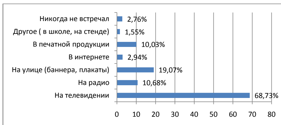
Рис. 1. Влияние антинаркотической рекламы

Эффективность проводимой в республике информационной деятельности подтверждают результаты масштабного (более 2 тыс. населения) социологического исследования, проведенного в 2012 г. компанией «TIGI» – 68,7% опрошенных респондентов отметили, что чаще всего наблюдают антинаркотическую пропаганду именно на телевидении.